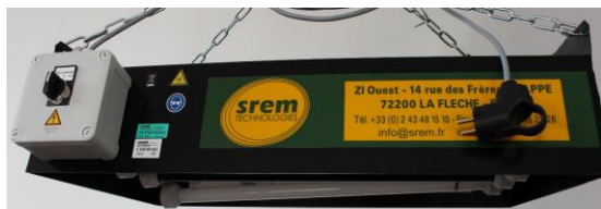
3 tubes UV - 1 tube blanc - longueur 600

Ce niveau d'éclairage peut être obtenu en utilisant soit des plafonniers, soit des projecteurs manuels.